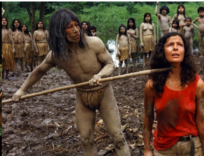
Holocaust Cannibal (1980)