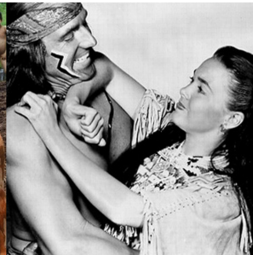
Taza Son of Cochise (1954)