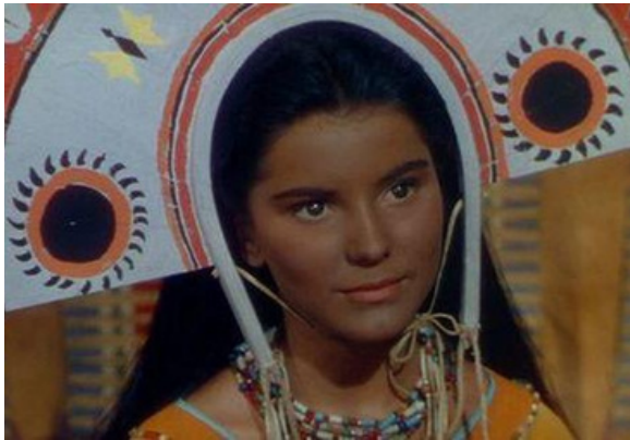
Film 'Broken Arrow' (1950)

Les femmes autochtones sont souvent représentées comme des objets de convoitise dans les films hollywoodiens. Représenter les femmes autochtones comme aimant la promiscuité tout en étant des objets de fantasmes pour les hommes blancs a eu des conséquences importantes dans le monde réel. Les femmes autochtones ont des taux disproportionnellement élevés d'agressions sexuelles , souvent perpétrées par des hommes non autochtones (Thoughtco).