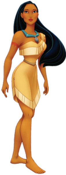
Film Pocahontas (1995)

Indigenous women are often portrayed as objects of lust in Hollywood films. Representing Indigenous women as tending to be promiscuous and objects of desire for White men have had significant real-world consequences. Indigenous women suffer from disproportionately high rates of sexual assaults , often perpetrated by non-Indigenous men. (Thoughtco)