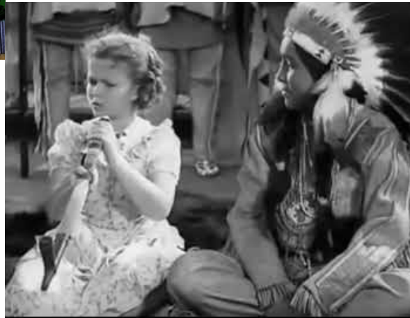
Susannah of the Mounties (1939)

Les hommes autochtones sont souvent représentés dans les films et les émissions de télévision comme des hommes sages dotés de pouvoirs magiques. Se présentant généralement comme des guérisseurs, ces personnages n'ont guère d'autres fonctions que de guider les personnages blancs dans la bonne direction.