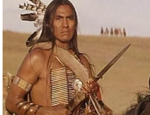
Dances with Wolves (1990)

The Indigenous represented in the movies many times don't show emotion and speak very little. This depiction portrays them as one-dimensional people who lack the ability to experience or display a range of emotions similar to that of other people.