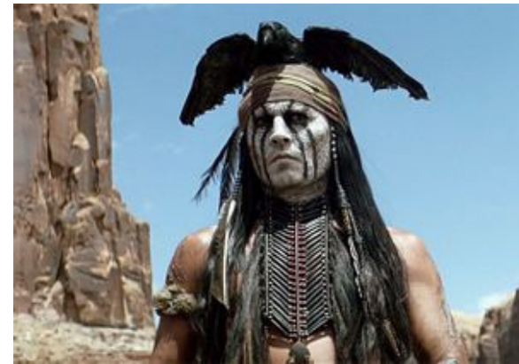
The Long Ranger (2013)