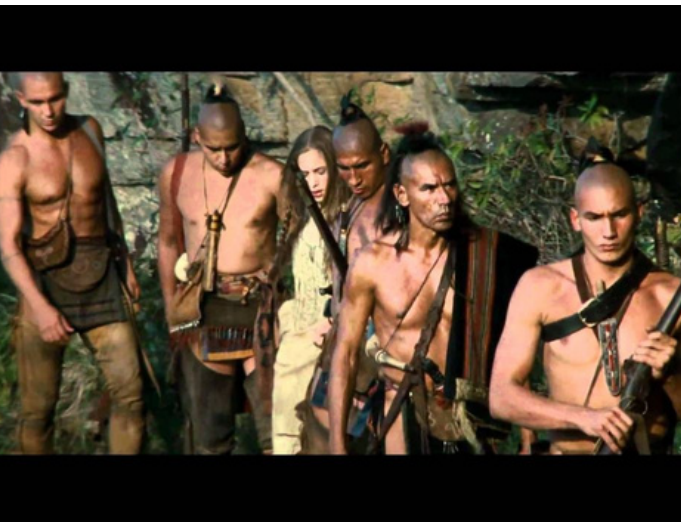
The Last of the Mohicans (1992)

Hollywood has many times depicted Indigenous people as being " savages " that are very violent and aggressive and are quick to attack white people.